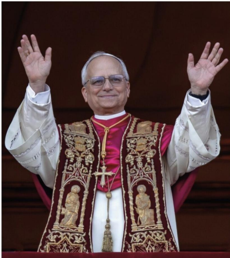
LEO XIV Robert Francis Prevost °14.09.1955 - CHICAGO