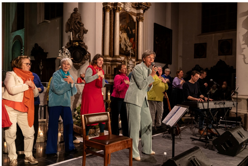
(c.) PE - Norbertus

Moge het ons allen gegeven zijn in dit jaar van Hoop, dat wij de deuren van ons hart openstellen voor de bakens van hoop die zich op ons levenspad bevinden, en zo bakens, lichtpunten in donkere momenten, zijn voor onze medemensen.