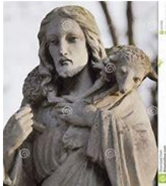
Jezus de Goede Herder