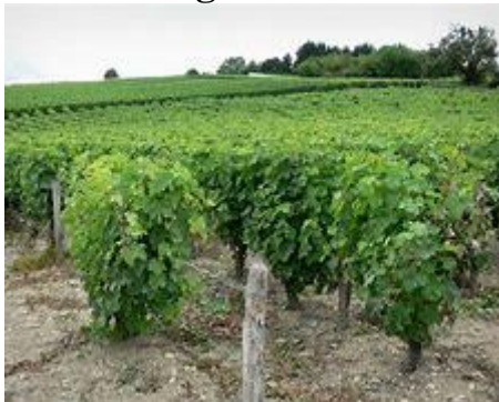
“Wie in Mij blijft draagt veel vrucht”

Eerste lezing: Hand 9. 26-31 Evangelie: Joh 15.1-8