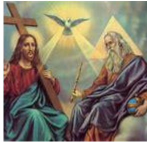
Vader Zoon en Geest