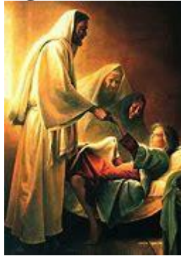
Getuigenis over Jezus

Donderdag 18 maart 2021 (Donderdag in de 4 de week van de veertigdagentijd) Eerste lezing: Ex 32, 7-14 Evangelie: Joh 5, 31-47