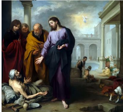
Jezus en de verlamde man

Dinsdag 16 maart 2021 (Dinsdag in de 4 de week van de veertigdagentijd) Eerste lezing: Ez 47, 1-9.12 Evangelie: Joh 5, 1-3a5-16