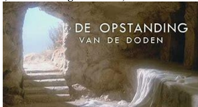
De doden zullen Gods stem horen

Woensdag 17 maart 2021 (Woensdag in de 4 de week van de veertigdagentijd) Eerste lezing: Jes 49, 8-15 Evangelie: Joh 5, 17-30