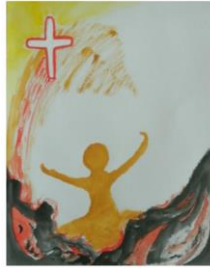
Jezus geneest de zoon van een hoveling

Maandag 15 maart 2021 (maandag in de 4 de week van de veertigdagentijd) Eerste lezing: Jes. 65.17-21 Evangelie: Joh 4, 43-54