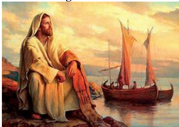
“Komt de Messias uit Galilea?”