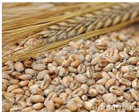
“Als de graankorrel in de aarde sterft.”