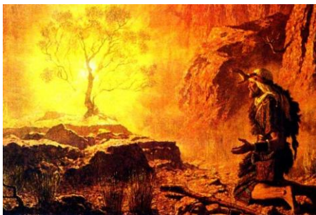
Geroepen worden door God