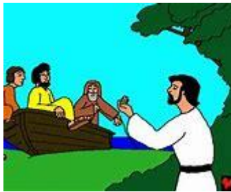
Jezus roept zijn leerlingen

Vrijdag 22 januari 2021 Thema Gebedsweek: "Omgevormd door het Woord". Eerste lezing: Hebr8 .6-13 Evangelie: Mc 3.13-19