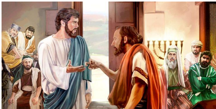
Genezing op sabbat