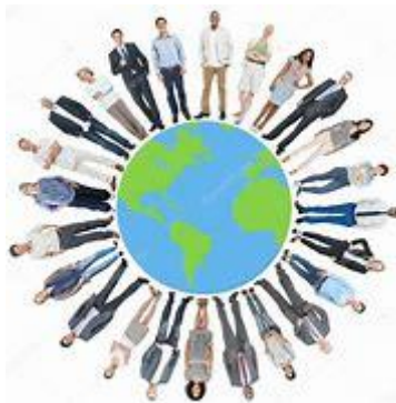
Gastvrij voor de ander

Zaterdag 23 januari 2021 Thema Gebedsweek:” Gastvrij voor de ander”. Eerste Lezing: Hebr 9, 2-3. 11-14 Evangelie: Mc 3, 20-21