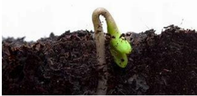
Zaadjes ontkiemen en groeien

Dinsdag 19 januari 2021 Thema Gebedsweek: “ Inwendig groeien”. Eerste lezing: Hebr 6, 10-20 Mc 2, 23-28