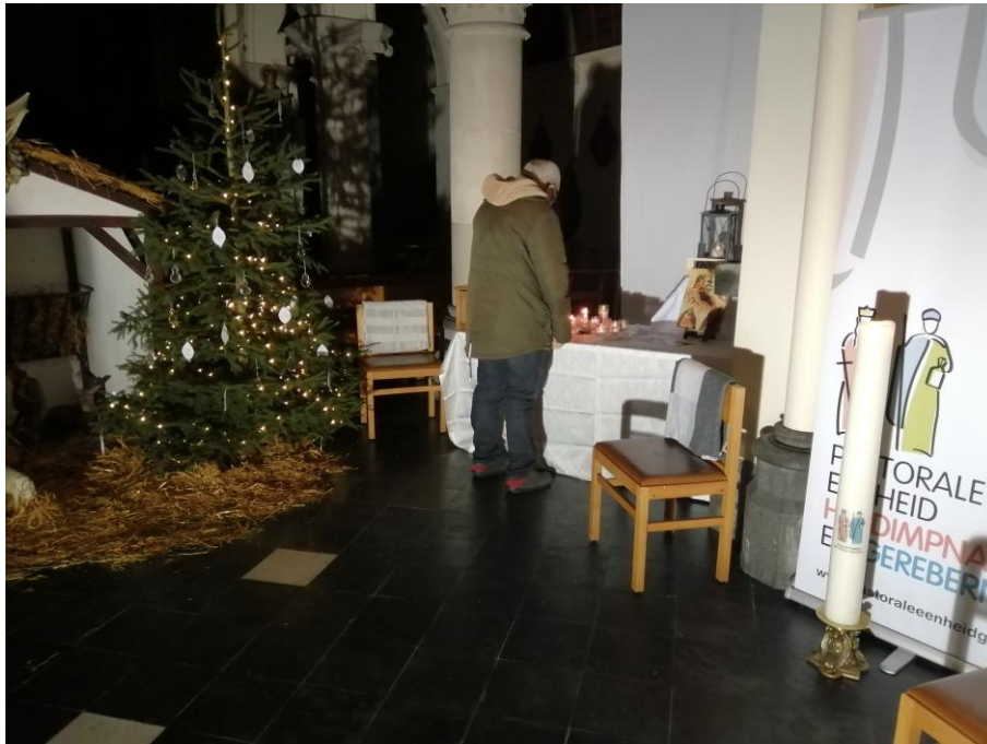
Het Licht van Betlehem in de kerk van Oosterlo

Van 17 tot 24 december bracht het Licht van Betlehem een bezoek aan alle kerken van onze Pastorale Eenheid.