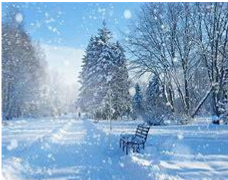
Dromen van de winter

Nauwelijks ben ik weer in huis, of het gefladder gaat beginnen, ieder vecht om een stukje brood maar ik ben lekker binnen