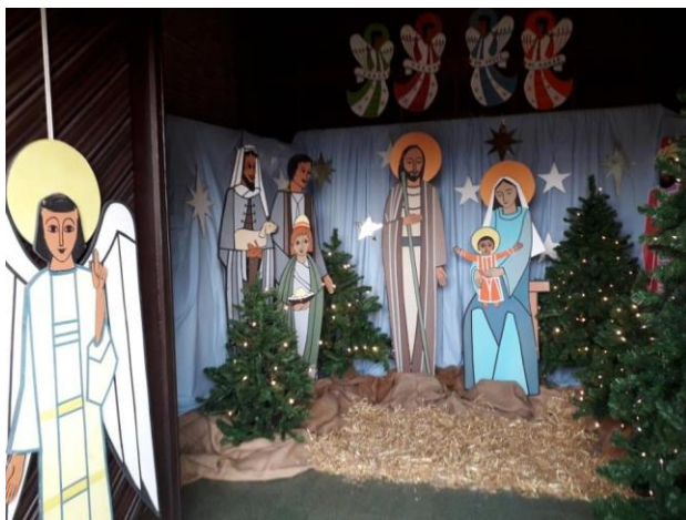
Kerststal in de kerk van Winkelomheid

Er kwamen in totaal 493 verschillende bezoekers af in de 11 parochiekerken. Er werden 320 kaarsjes uitgedeeld wat samenhangt met 320 gezinnen. In totaal bereikten we dus meer mensen dan de 493 want velen namen een kaarsje mee voor een zieke of oudere. Er kwamen zelfs mensen uit Beersel en Ravels om het licht te halen. We stonden met ons project van het Licht van Betlehem in 2 kranten en op de rolkrant van RTV. We verschenen ook op de facebookgroepen van de deeldorpen. In alle kerken hadden ze hun kerstversiering bovengehaald. Er werd enorm hard gewerkt om alles mooi te maken voor het Licht van Betlehem. Wij willen iedereen dan ook van harte bedanken omdat ze op welke wijze dan ook aan dit project hebben meegewerkt.