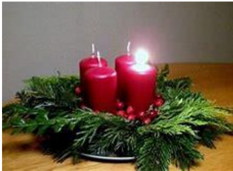
Eerste zondag van de Advent

Eerste lezing: Jes 63, 16b-17.19b:64,2b-7 Evangelie Mc. 13,33-37