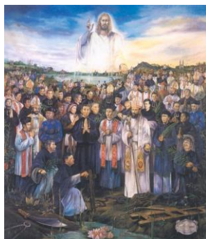
HH. Martelaren van Vietnam

Eerste lezing: Apok. 15, 1-4 Evangelie: Lc 21, 12-19