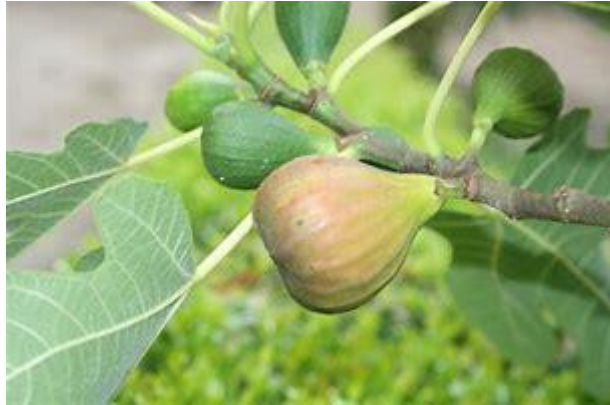
Vruchten van de vijgenboom

Eerste lezing: Apok 20, 1-4.11-21,2 Evangelie: Lc. 21, 29-33