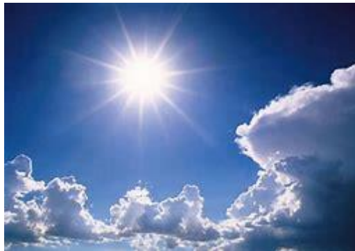
Geweldige tekenen aan de hemel

Eerste lezing: Apok. 14,14-19 Evangelie: Lc. 21, 5-11