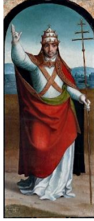
Paus Clemens I

Eerste lezing: Apok. 14, 1-3.4b-5 Evangelie: Lc 21, 1-4