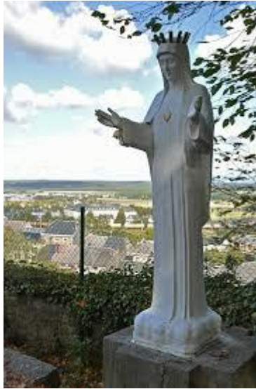
Onze Lieve Vrouw van Beauraing