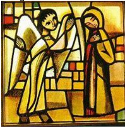
Wees gegroet Maria

Dinsdag 8 december 2020 Hoogfeest: Maria onbevlekt ontvangen Eerste lezing: Gen. 3, 9-15.20 Evangelie: Lc. 1 26-38