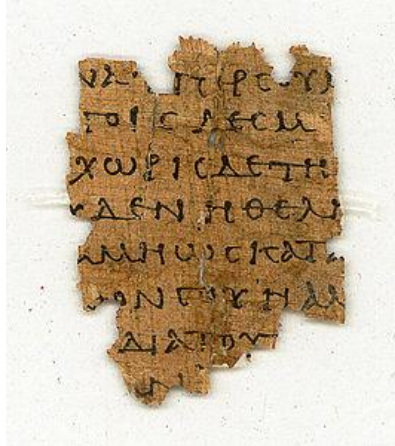
Oudste bekende handschrift van Filémon