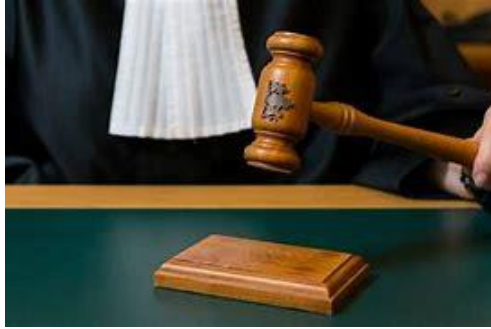
De onrechtvaardige rechter