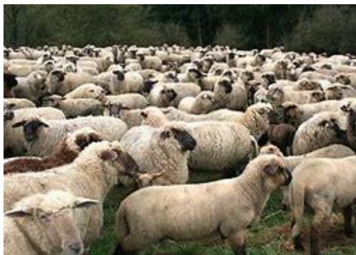
Schapen zonder herder

Zaterdag 6 februari 2021 Feest van de H. bisschop Amandus Eerste lezing: Hebr 13. 15-17.20-21 Evangelie: Mc 6. 30-34