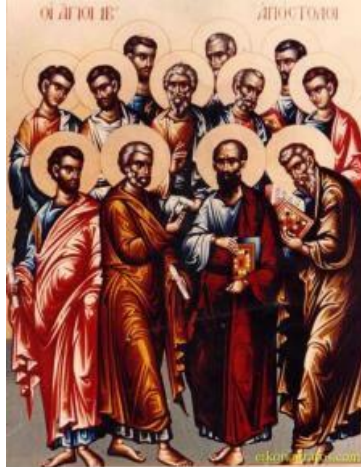
De leerlingen worden gezonden door Jezus

Eerste lezing: Hebr 12.18-19.21-24 Evangelie: Mc6.7-13