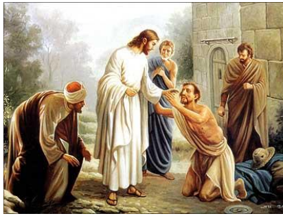
Genezing van een onreine geest

Eerste lezing: Hebr 11.32-40 Evangelie: Mc 5.1-20