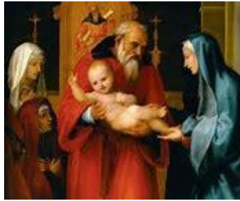
Opdracht van de Heer