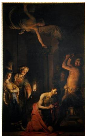
Onthoofding van Johannes de Doper