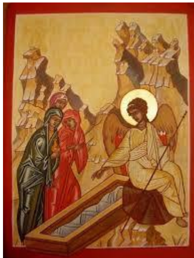
De vrouwen bij het lege graf

Moge ook jij geloven dat Pasen ook aan jou nieuwe levenskracht geeft. (Antoon Vandeputte)