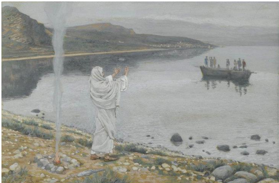
Kom nu maar met Mij eten