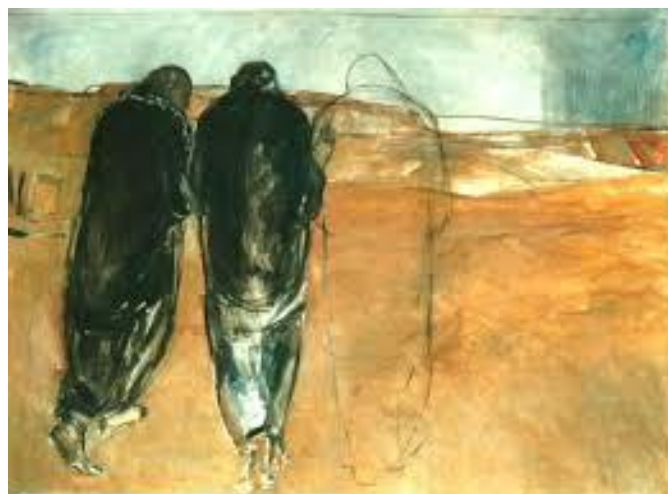
Jezus gaat met hen mee naar Emmaüs