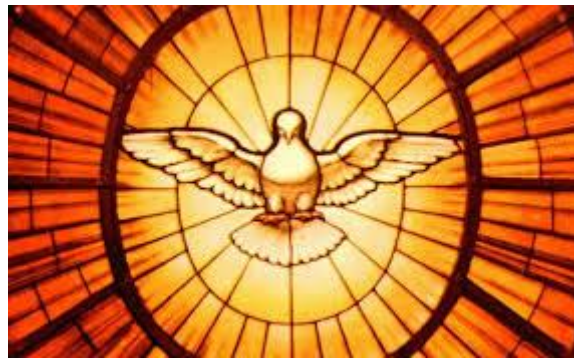
50 dagen wachten op de Heilige Geest

Jezus belooft aan zijn discipelen de Heilige Geest te geven, maar ze moeten er maar liefs vijftig dagen opwachten. Je ziet trouwens in de Bijbel wel vaker, dat God mensen laat wachten. Alleen al in het Nieuwe Testament als we kijken naar hoe Jezus reageert op mensen die naar hem toekomen. Hoe vaak is hun geduld niet op de proef gesteld. Dat Jezus tegen zijn discipelen zei: 'mijn tijd is nog niet gekomen.' Of wat dacht u van al die mensen die Jezus om hulp kwamen vragen. Situaties waarin echt niet meer gewacht kon worden. Denk aan het dochtertje van Jairus, de knecht van de hoofdman van Kafarnaüm, Lazarus de broer van Martha en Maria. Mensen die hals over kop naar Jezus toekomen, maar Jezus lijkt voor iedereen tijd te hebben en haast zich niet. Zij die geloven haasten zich niet. Het lijkt wel of wachten in het koninkrijk van God een deugd is.