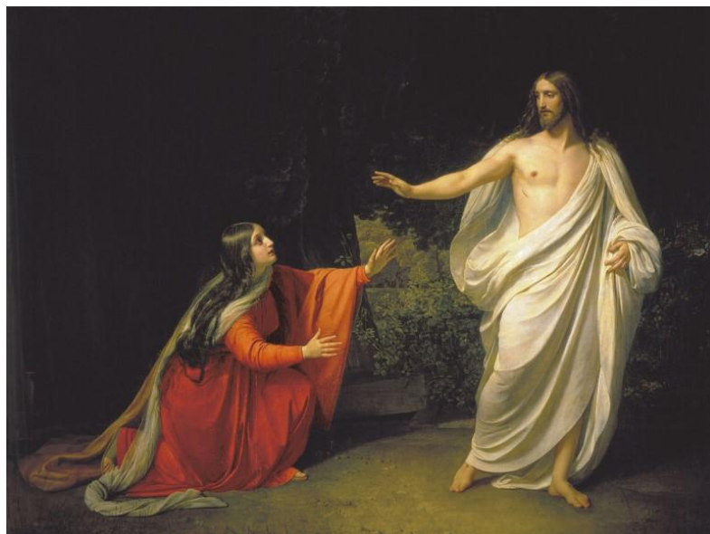
Maria Magdalena ontmoet Jezus na zijn Verrijzenis

Toen ze vroeg in de ochtend bij het graf kwam, zag zij dat de steen van de grafopening was weggenomen. Hiervan bracht ze Petrus en Johannes terstond op de hoogte: "Zij hebben de Heer weggenomen uit het graf, en wij weten niet waar zij Hem hebben gelegd". Daarna kwam zij bij het graf terug, en terwijl ze huilt, treft ze in het graf twee mannen (engelen) in witte kleren aan. Die zeiden tot haar: „Vrouw, waarom ween je?" Zij zei tot hen: „Omdat zij mijn Heer hebben weggenomen en ik weet niet waar zij Hem hebben gelegd". Toen zij dit had gezegd, keerde zij zich om en zag een derde persoon staan. Deze zei tot haar: „Vrouw, waarom ween je? Wie zoek je?" Zij meende dat het de tuinman was en zei tot Hem: „Heer, als u Hem weggedragen hebt, zeg mij waar u Hem gelegd hebt en ik zal Hem wegnemen". Daarop zei de onbekende: „Maria!" Dan herkende ze de stem van haar Jezus. Zij keerde zich om en zei tot Hem in het Hebreeuws: „Rabboeni! (= Meester!)".