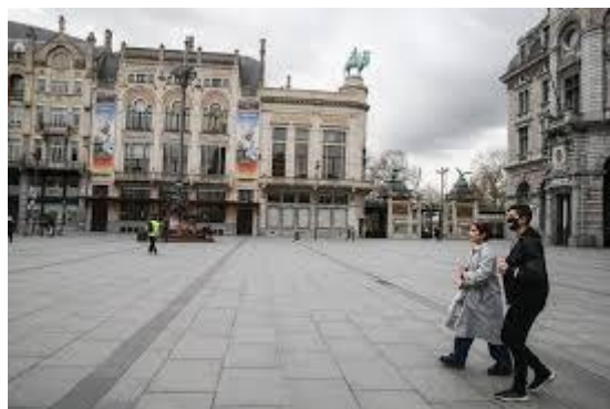
Lege straten en pleinen overal