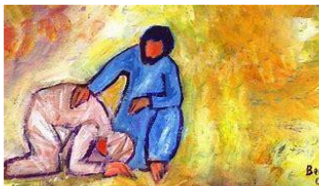
Jezus en de melaatse