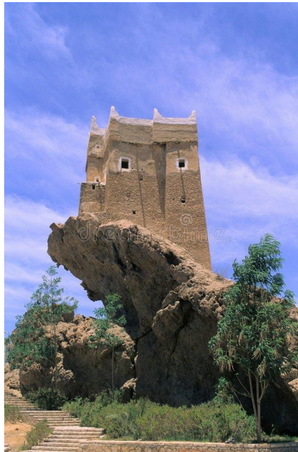
Het huis op de rots