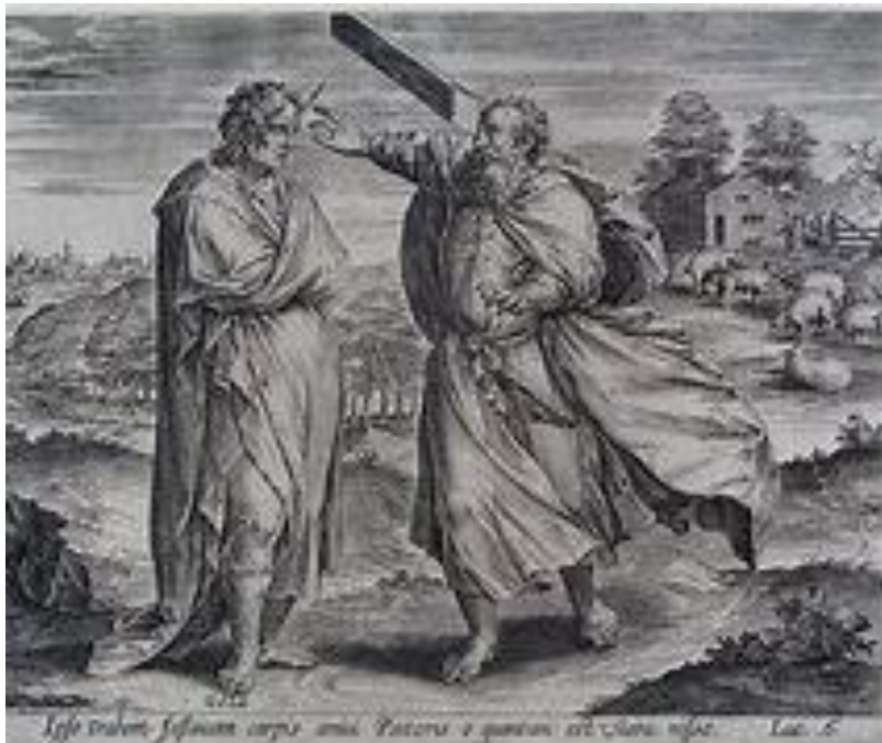
De splinter en de balk

Jezus leerde ons een gebed waarin het vergeven ook centraal staat. Laten we dit tot slot bidden.