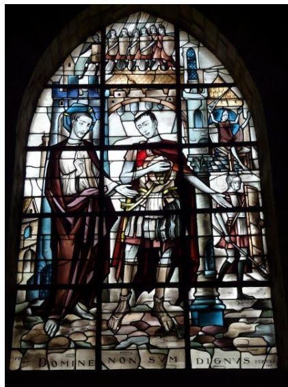
Jezus ontmoet de honderdman